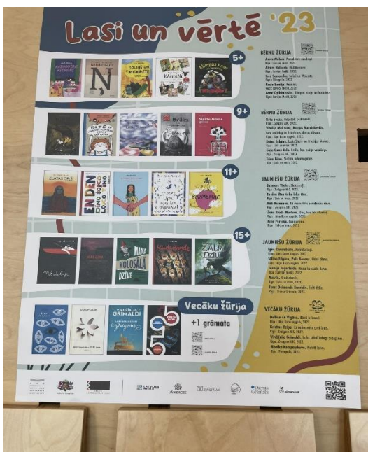
LNB iepazīnāmies ar populārāko bērnu grāmatu TOPU dažādās vecuma grupās