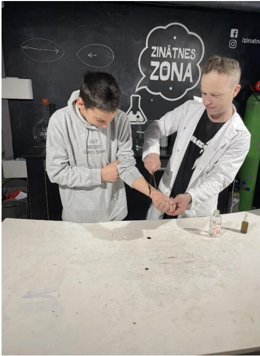
“Zinātnes zona” mākslīgās asinis