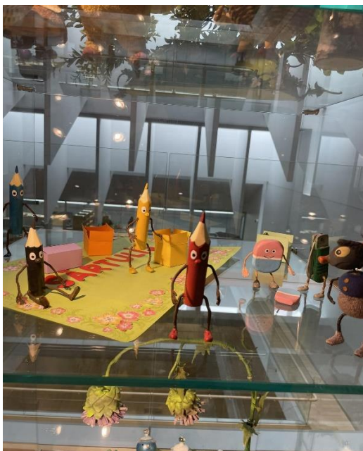
Margaritas Stārastes 110. gadu jubilejas izstādes ekspozīcija