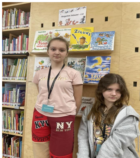
Margaritas Stārastes 110. gadu jubilejas izstādē