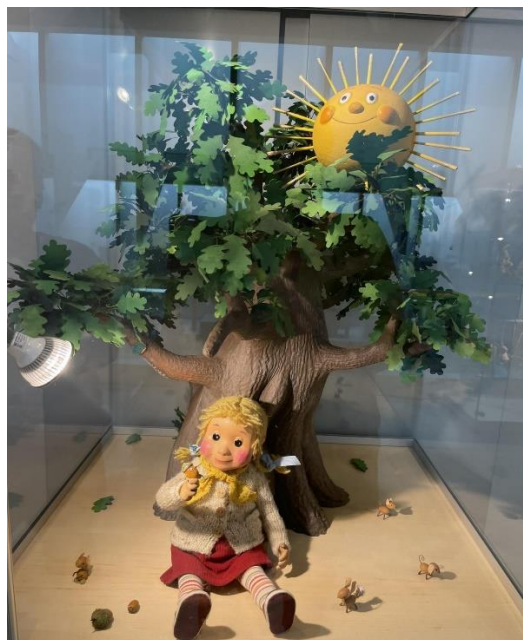
Margaritas Stārastes 110. gadu jubilejas izstādes ekspozīcija