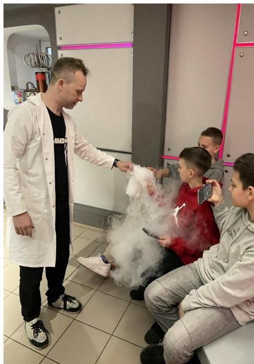
"Zinātnes zona" miglas un mākoņu veidošana