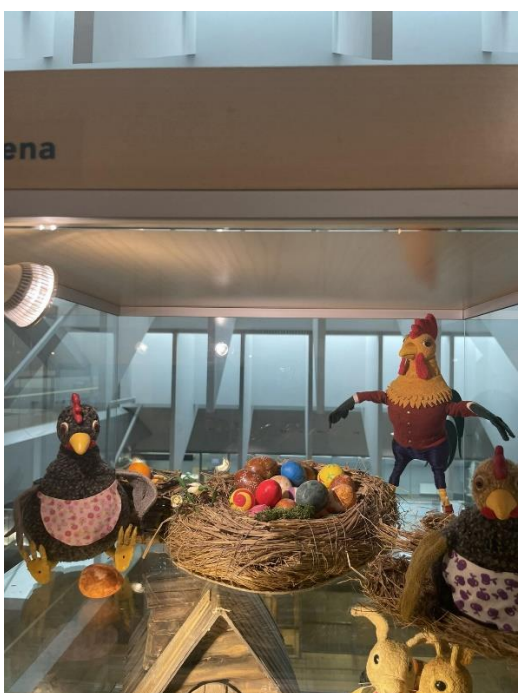
Margaritas Stārastes 110. gadu jubilejas izstādes ekspozīcija