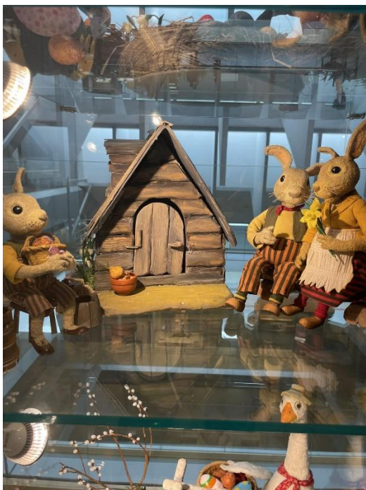
Margaritas Stārastes 110. gadu jubilejas izstādes ekspozīcija