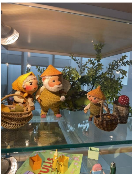
Margaritas Stārastes 110. gadu jubilejas izstādes ekspozīcija