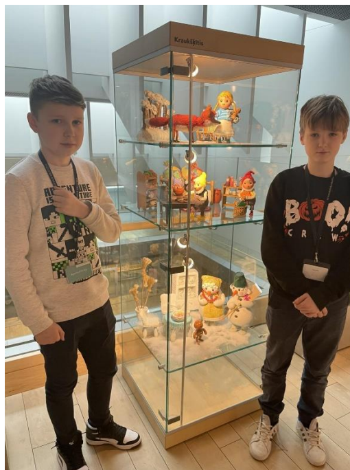
Margaritas Stārastes 110. gadu jubilejas izstādes ekspozīcija pasakai "Kraukšķītis".