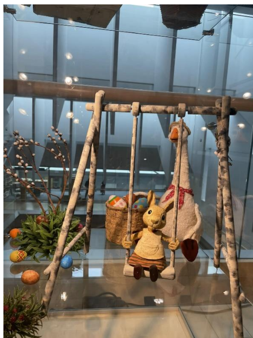
Margaritas Stārastes 110. gadu jubilejas izstādes ekspozīcija