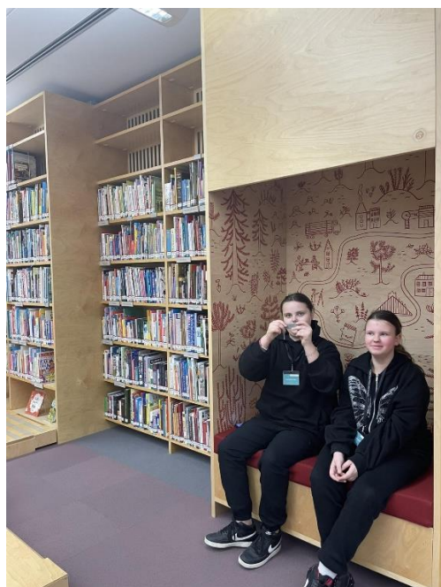
LNB Bērnu literatūras centrā