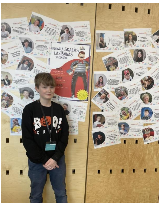
Pie plakāta "Nacionālā skajās lasišanas sacensība 5.klasēm", kur redzami iepriekšējo gadu uzvarētāji.