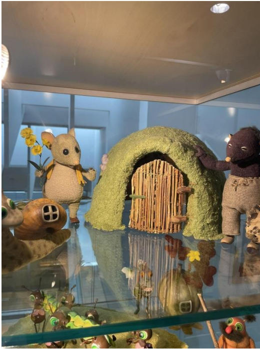
Margaritas Stārastes 110. gadu jubilejas izstādes ekspozīcija