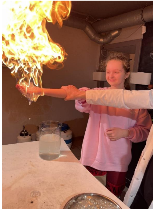
“Zinātnes zona” uguns, kas neapdedzina