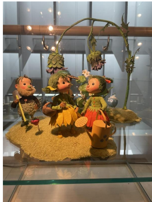
Margaritas Stārastes 110. gadu jubilejas izstādes ekspozīcija