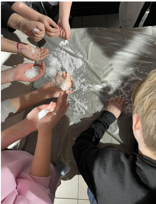
“Zinātnes zona” mākslīgais sniegs