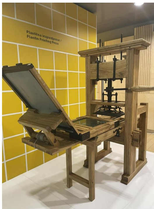
Latvijas Nacionālās bibliotēkas vēsturiskais dārgums-Plantēna iespiedprese (Platēna iespiedprese, kas pazīstama arī kā fleksogrāfiska preses, ir drukas tehnoloģija, kas tika attīstīta 19. gadsimta beigās un 20. gadsimta sākumā. Tā ir mehāniska preses sistēma, kas izmanto elastīgas gumijas plāksnes vai platēnas, lai pārnestu attēlus uz dažādiem elastīgiem materiāliem).