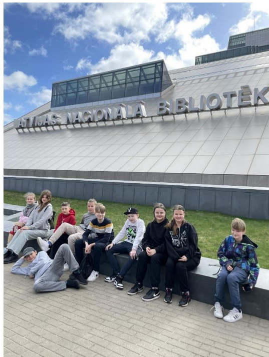
Pie Latvijas Nacionālās bibliotēkas (LNB)