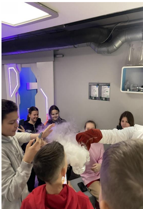
"Zinātnes zona" miglas un mākoņu veidošana