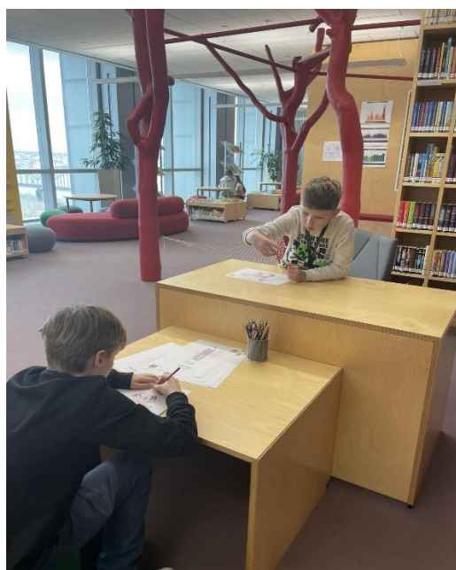
LNB Bērnu literatūras centrā dažādi Margaritas Stārastes pasaku tēli krāsojamās bildēs