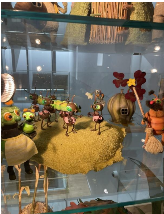
Margaritas Stārastes 110. gadu jubilejas izstādes ekspozīcija