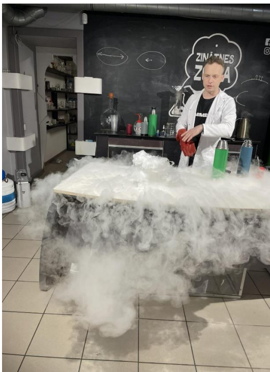
"Zinātnes zona" miglas un mākoņu veidošana